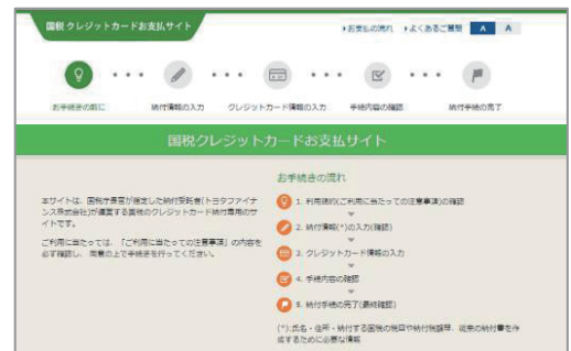
国税クレジットカードお支払サイト

クレジットカード納付の場合、領収書は発行されません。金融機関等に領収書を求められた場合、ご自身で納税証明を取得する等の手続きが発生します。ご注意ください。